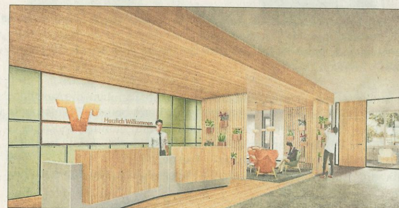
Im Inneren gibt es sowohl offene Arbeitsräume zum kommunikativen Austausch als auch geschlossene Beratungsplätze für die nötige Privatsphäre. – Visualisierung: Oberhaizinger IDP

„Open-Space“-Raumkonzept entschieden. So soll ein „Arbeitsumfeld mit reger Kommunikation unter Mitarbeitern entstehen und damit Kreativität und Produktivität gefördert werden“. Gleichzeitig gibt es aber auch Rückzugsmöglichkeiten, etwa für ein vertrauliches Telefonat. „Wenn die Mitarbeiter das kostbarste Gut jedes Unternehmens sind, dann muss man auch einen tollen Arbeitsplatz schaffen“, ist sich Griebel sicher. Für die VR-Bank Rottal-Inn sei die Bad Birnbacher